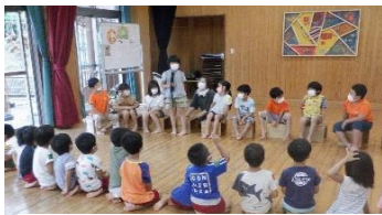
インタビュー 好きな教科を聞きました☆