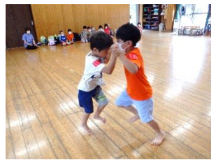
けんけん相撲は1年生の全勝！！強かったです☆