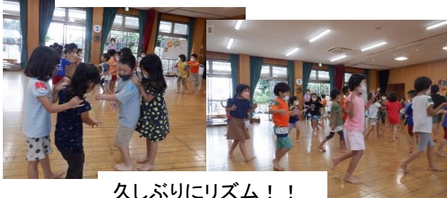
久しぶりにリズム！！